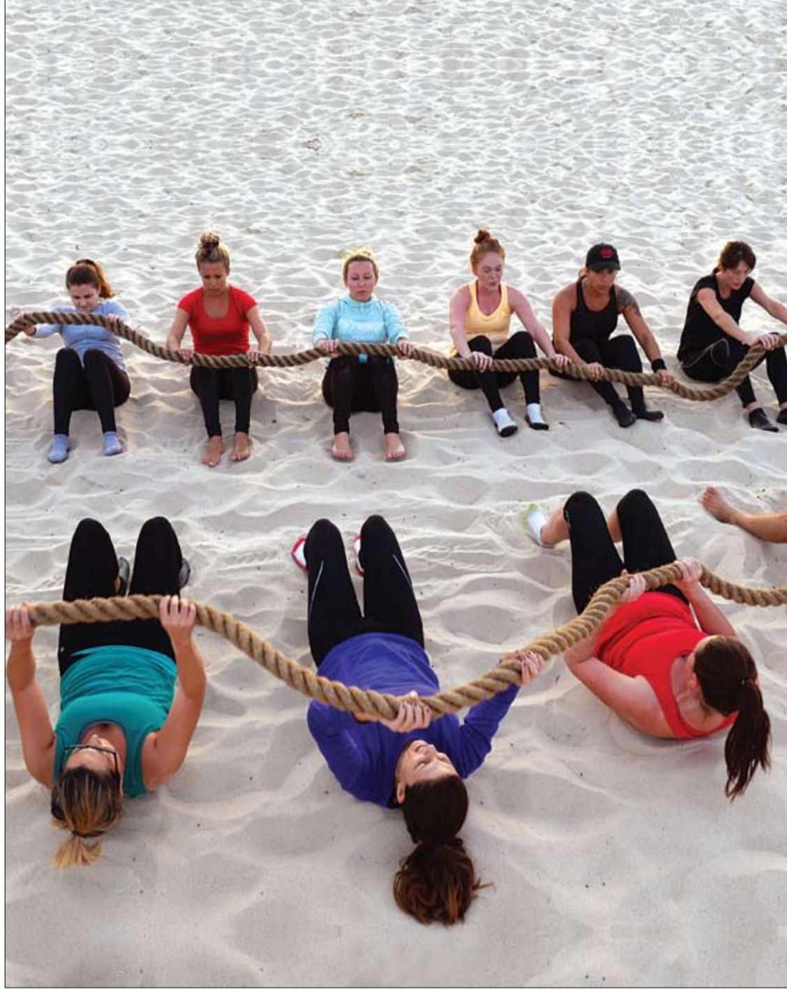
مجموعة من المشاركات في مخيم عمل على شاطئ بوندي الشهير في سيدني يؤدين تدريبات في الهواة الطلق. (ا ف ب)

أظهرت دراسة جديدة أجرتها جامعة نوتردام بولاية إنديانا الأمريكية، أن الامهات اللاتي تعرضن في مرحلة الطفولة لإساءة المعاملة أو الإهمال أو غيرها من التجارب النفسية المؤلمة، يكن أقل استعداداً للحدوث مع أطفالهن بشأن التجارب العاطفية التي يمر بها الطفل. وذكر موقع ساينس ديلي المعني بشؤون العلم إنه بحسب الدراسة التي جرى تقديمها خلال اجتماع هذا العام في سياتل لجمعية الأبحاث الخاصة بتطور الطفل، الذي يعقد كل عامين، أن عينة من الامهات من ذوي الدخل المنخفض واللاتي تعرضن لجروح نفسية في مرحلة الطفولة أظهرت أعراض تجنب استعادة التجارب النفسية المؤلمة التي تتمثل في عدم الاستعداد لاستعادة الأفكار أو الانفعالات أو الاحاسيس أو الذكريات المرتبطة بتلك الجروح النفسية. هذا التناقض أو العزوف عن تذكر التجارب النفسية المؤلمة له علاقة بقدره الامهات على الحديث مع أطفالهن عن عواطف وانفعالات الطفل، الامر الذي يؤدي إلى أن يكون الحديث بينهم قصيراً وأقل عمقا، كما أن هذه الامهات تستخدم أيضاً أسئلة باترة قاطعة لا تسمح بالرد ولا تشجع الطفل على المشاركة والاسترسال في الحديث. وتقول كريستين فالينتينو، أستاذ مساعد الطب النفسي بجامعة نوتردام، التي أجرت البحث إن أعراض تفادي استعادة الذكريات المؤلمة أظهرت تأثيرها السلبي على التطور الإدراكي والوجداني للأطفال . وأوضحت فالينتينو أن هذا البحث يعد مهماً لأنه يحدد آلية يمكننا بها فهم كيفية ارتباط الجروح النفسية للأمهات بمدى قدرتهن على التفاعل بشكل فعال مع أطفالهن .